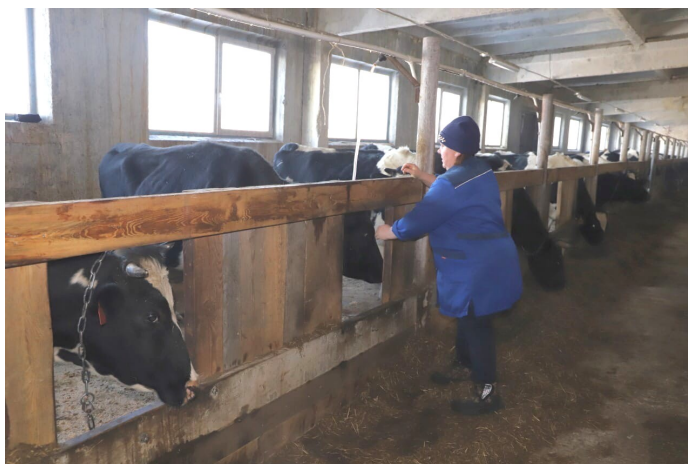
Животноводческая ферма ФГУП «Буретское»

В деревне находятся МБОУ «Буретская СОШ», детский сад «Сказка», сельский клуб «Родник» и ФГУП «Буретское», где трудится основная часть населения деревни.